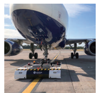
Mototok社製 リモコン式電動航空機牽引機材