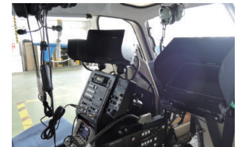
航空技術センター改修作業 (JAEC Modification work)