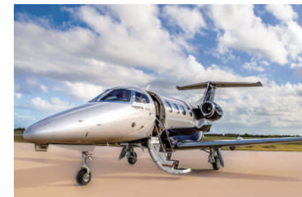
ビジネスジェット