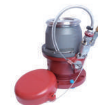
EATON 社 (旧 J.C. カーター) 製 地上給油機器