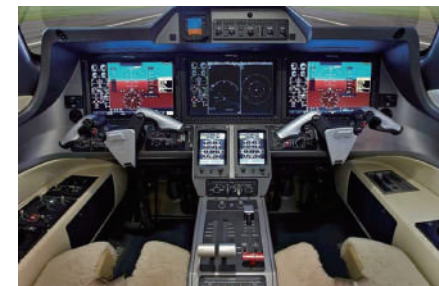
Garmin アビオニクスシステム G3000