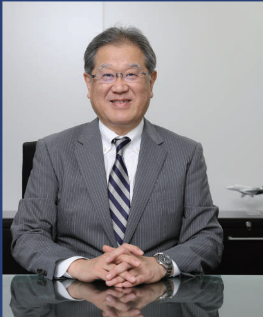
代表取締役社長 President & CEO