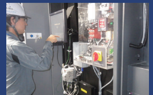
MV3D保守点検作業 / Maintenance of MV3D

We have a Technical Support Center that can conduct installation, maintenance and emergency support for the products that we sell. The technical experts provide swift and accurate technical and after sales support to satisfy our customer's various needs 24 hours a day, 365 days a year.